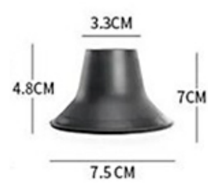
Wash basin/ floor drain plug