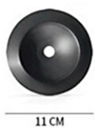
Dish basin plug